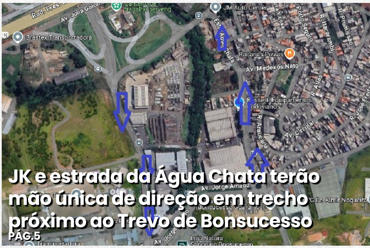
JK e estrada da Água Chata terão mão única de direção em trecho próximo ao Trevo de Bonsucesso