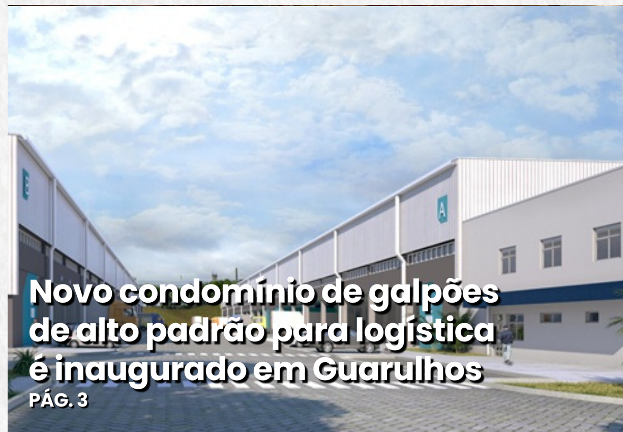
Novo condomínio de galpões de alto padrão para logística é inaugurado em Guarulhos